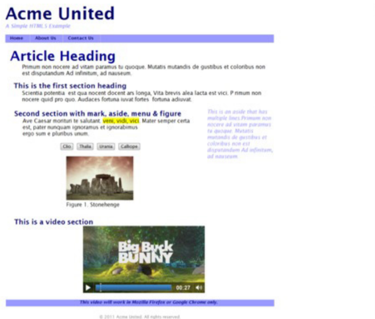
Рисунок 2. Web-страница Acme United

Итак, приступим к формированию страницы. Сначала следует тег <!doctype>. В спецификации HTML5 тег <!doctype> был упрощен: вам достаточно запомнить его атрибут —html. Это не только облегчает ввод этого тега, но и улучшает его защиту от ошибок. Обратите внимание, что атрибут имеет вид html, а не html5. Вне зависимости от количества версий HTML, тег <!doctype> всегда сможет иметь атрибут html.